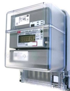
九州電力ユニット式計器